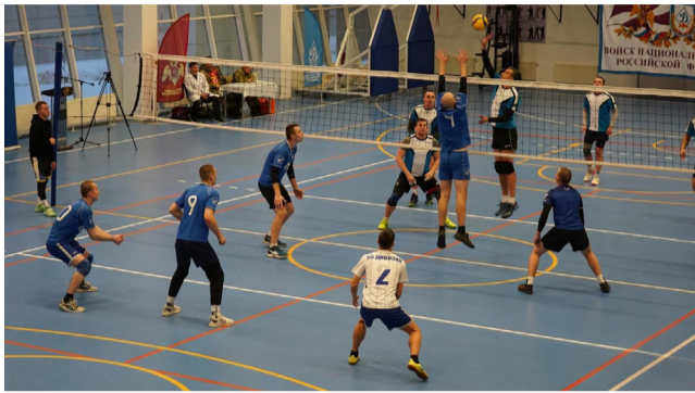
Восемь команд, представляющих территориальные органы и воинские части

В Москве состоялся чемпионат Центрального округа войск национальной гвардии Российской Федерации по волейболу